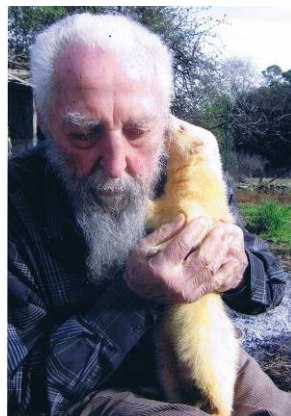
Papa de Sr Pascale